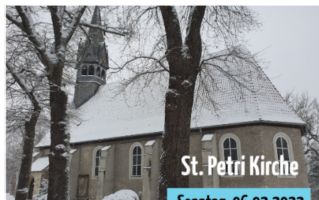
Gottesdienst in der Kirche (09.30 Uhr)