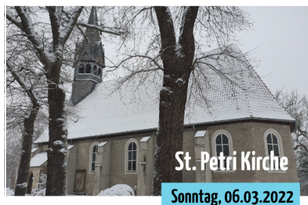
Gottesdienst in der Kirche (09.30 Uhr)