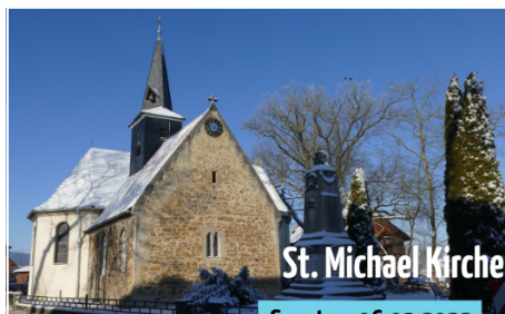
Gottesdienst in der Kirche (11.00 Uhr)