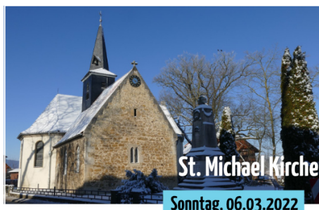
Gottesdienst in der Kirche (11.00 Uhr)