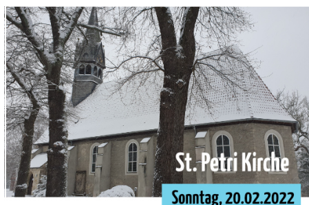
Gottesdienst in der Kirche (09.30 Uhr) mit Vorstellung der Konfirmanden