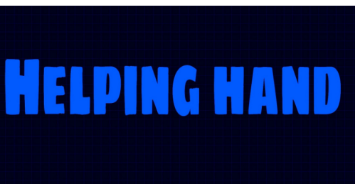
26 Dringend gesucht!