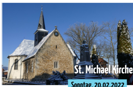
Gottesdienst in der Kirche (11.00 Uhr) mit Vorstellung der Konfirmanden