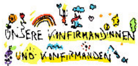
20 Unsere Konfirmanden