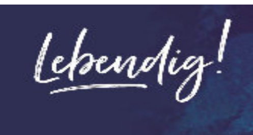
26 Predigtreihe lebendig