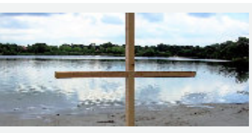
28 Tauffest am Tankumsee