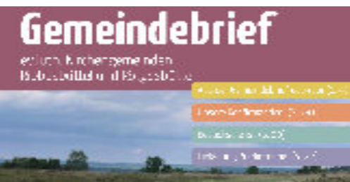
8 Aus der Gemeindebriefredaktion