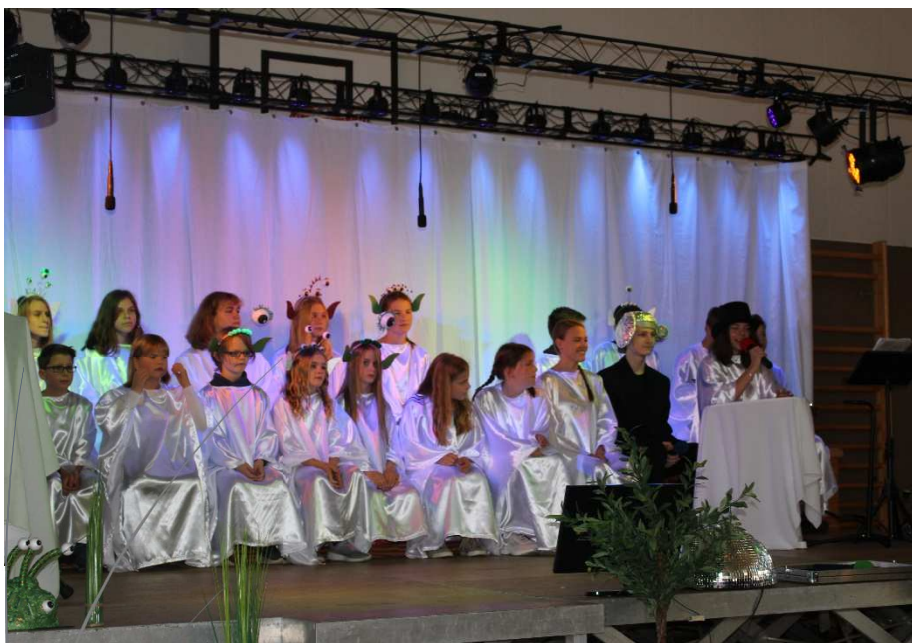
Musical in Ribbesbüttel: Besuch aus 5D