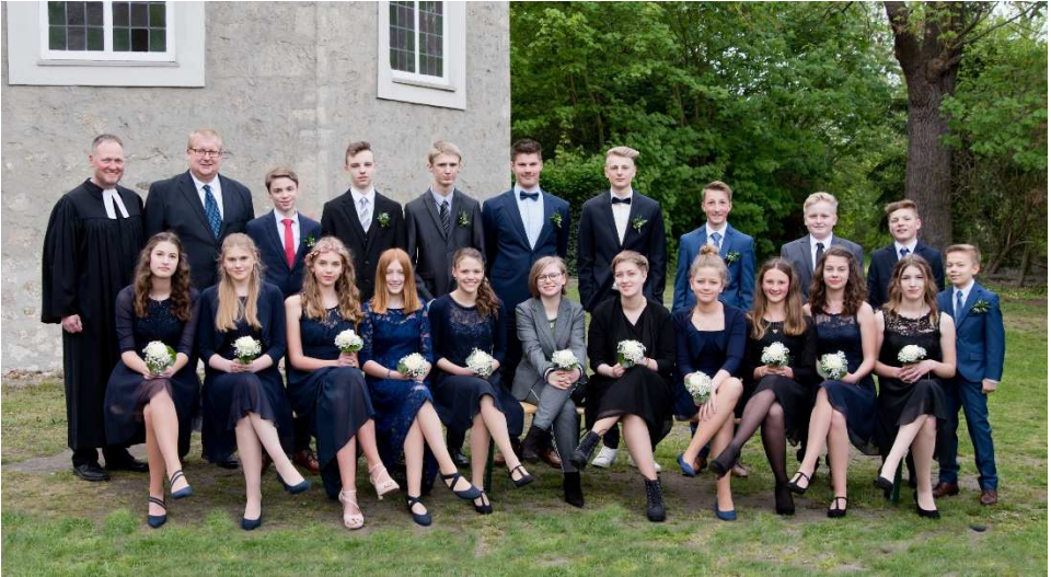
Konfirmanden aus Ribbesbüttel