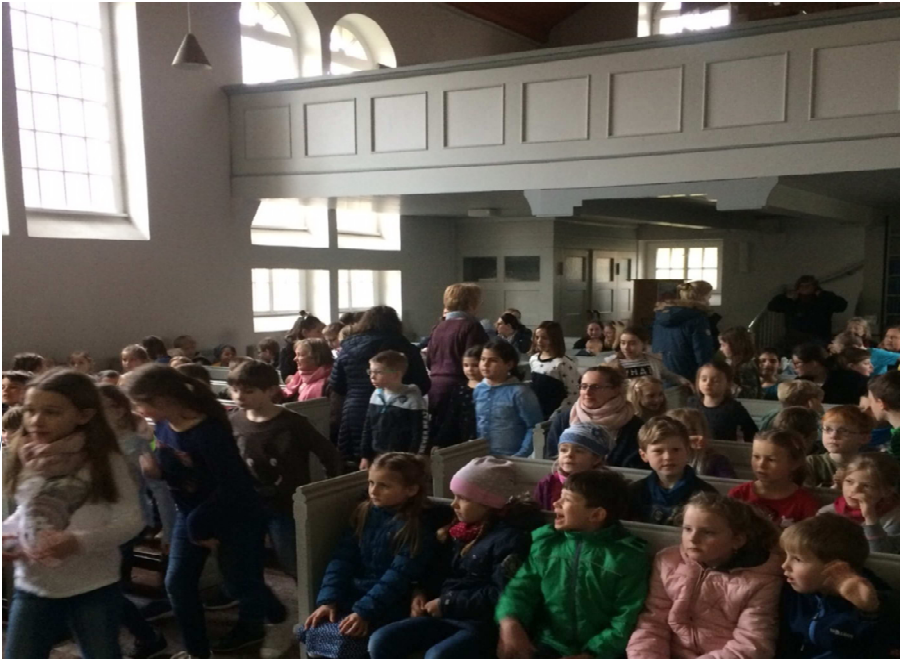
Schulgottesdienst der Grundschule in Rötgesbüttel