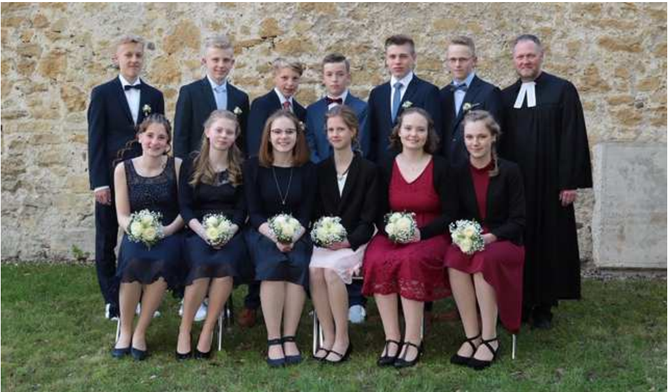
Konfirmanden aus Rötgesbüttel