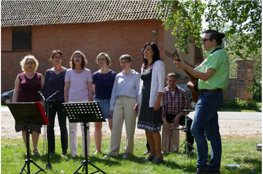
Regionalgottesdienst in Ribbesbüttel 2018