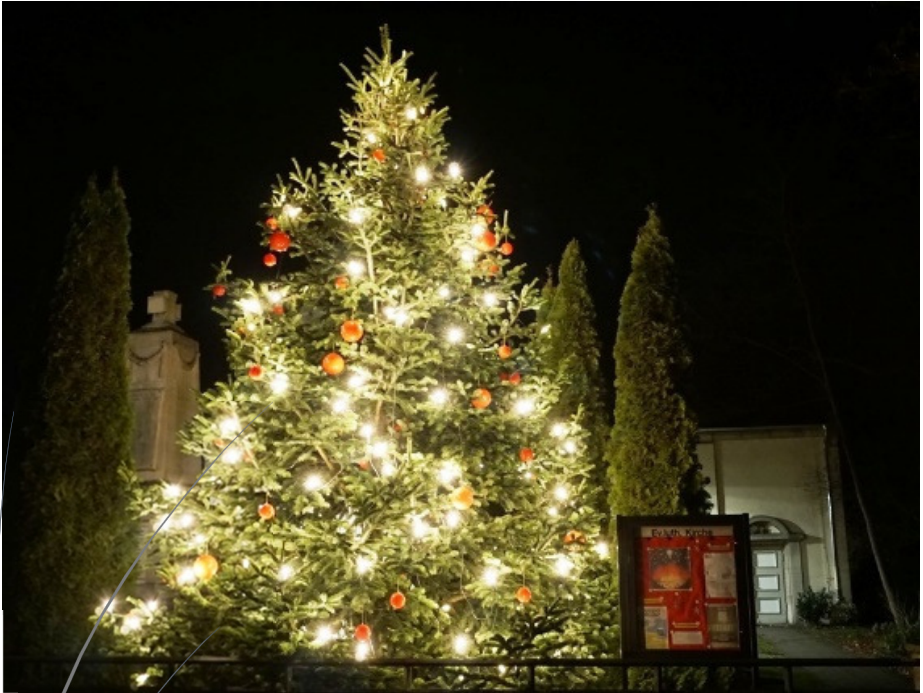
St. Michael Kirche, Rötgesbüttel 2016